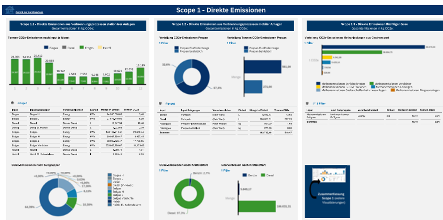
Abb. 1: Beispielhafte Visualisierung der ESRS E1 Scope 1 in der SAC